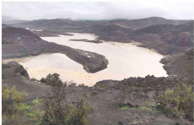
Así quedó el embalse La Paloma, en el Limarí, luego del chaparrón de las últimas horas.

sión de encima y tomar de terminaciones un poco más pausadas. Pero vamos a seguir monitoreando y trabajando, por cuanto el ministro nos encargó reactivar una mesa de manejo de crisis hídrica junto con la delegada del Limarí, para ir evaluando lo que está ocurriendo. Teníamos una tensión muy fuerte entre el agua de consumo humano por el embalse La Paloma y los mismos agricultores, que nos estaban pidiendo a gritos poder abrir el embalse...".