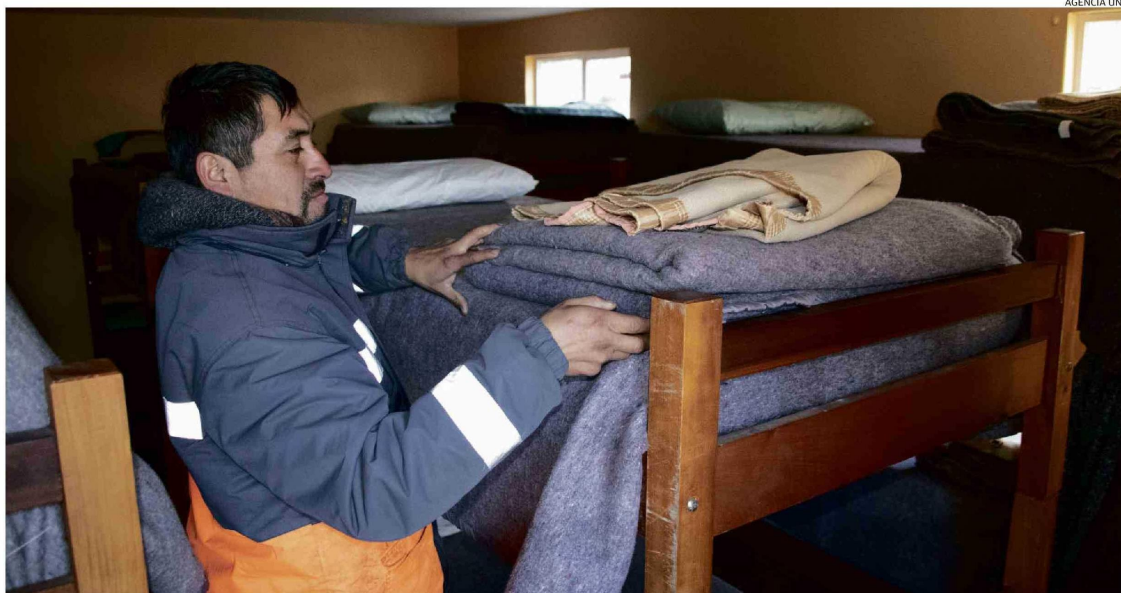
LOS ALBERGUES PÚBLICOS O PRIVADOS, COMO EL UBICADO EN RAHUE ALTO, AL LADO DE LA PARROQUIA SAN LEOPOLDO MANDIC, SON UNA OPCIÓN PARA PASAR LAS FRÍAS NOCHES.

Según reportes del Mideso, la cifra para 2024 de personas en situación de calle llegó a 21.272, donde la mayoría se concentra en la regiones Metropolitana, de Valparaíso y Bio Bio. En el caso de la Región de