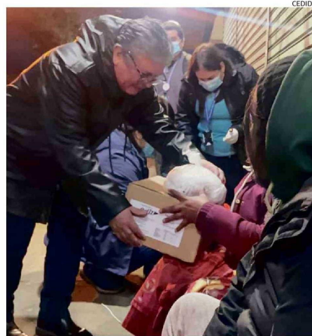
EL SEREMI DE DESARROLLO SOCIAL EN UNA DE LAS RUTAS CALLE.