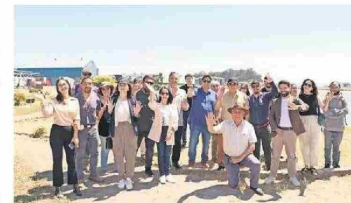
Talcahuano ya cuenta con su primer humedal urbano, el Redamo y Redacamo. Su declaración se concretó hace una semana.