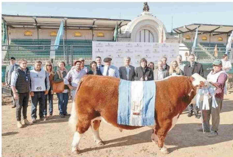
La semana pasada, en Palermo, el Presidente Javier Milei entregó el manto de ganador al "Gran Campeón Macho Hereford". Es un toro senior de casi 3 años, de nombre "Mark", que saldrá a remate el próximo mes. Pertenecer a la cabaña Los Murmullos, de Garruchos S.A.

El avión DC8 jet, de un valor de 10,5 millones de dólares, tenía capacidad para 251 pasajeros y tripulantes y antes de 8 horas fue transformado para embarcar las 267 vaquillas, con un promedio de peso de 159 kilos, teniendo capacidad de transporte de carga bruta de