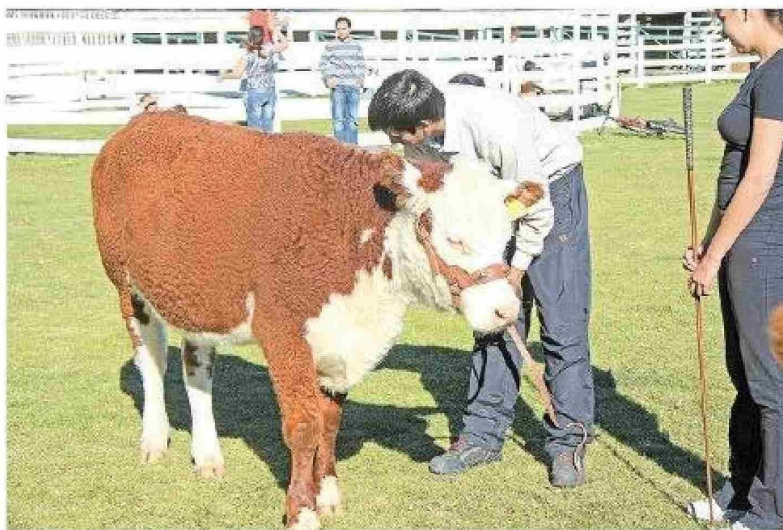
Ejemplares de la raza Hereford en la Exposición Ganadera de Magallanes, en marzo de 2011.

La celebración principal tuvo lugar este 13 de septiembre, donde Hereford coronó sus 100 años con los