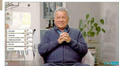
En la foto, la plataforma StoryFile, donde se muestra cómo se podría interactuar con un avatar. Se observa la réplica digital del actor William Shatner, conocido por su rol de capitán Kirk en la serie "Star Trek" y embajador del sitio.