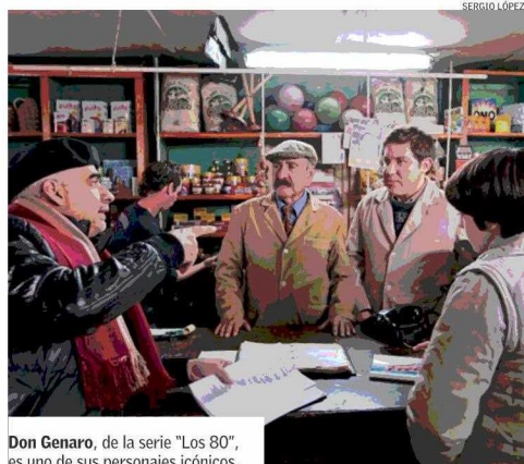
Don Genaro, de la serie "Los 80", es uno de sus personajes icónicos.

tuvo con su entonces jefe en Inchalam, y sigue— "Porque me gusta el teatro". "¡Son pampinas! Usted es buen operario. Quédese aquí. Se va a Bélgica a especializarse. Así que olvídese. No sea loco. Se le abre horizonte bueno. Lo otro es voladuras". Bueno, al final aceptó".