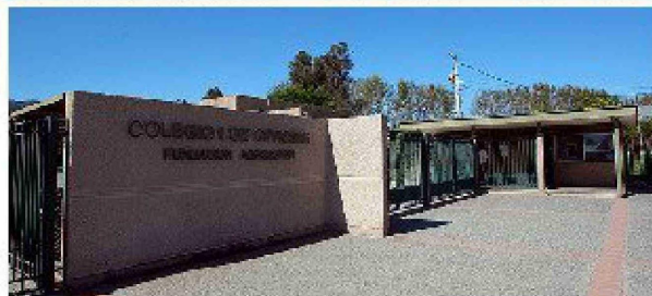
El Colegio Los Cipreses se posiciona en el noveno lugar del ranking con un promedio en el examen para el ingreso a la educación superior de 738,1.