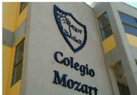
El Colegio Mozart de Machali, se ubica en el décimo puesto de los mejores 25 colegios subvencionados del país al obtener 736,9 como promedio PAES.

remos resaltar la confianza que nos han otorgado los apoderados todos estos años, considerando que la mayoría de la generación que egresó el año 2024 nos acompañó al menos desde primero