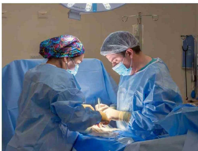
Procedimientos cardiológicos y neurointervencionistas.