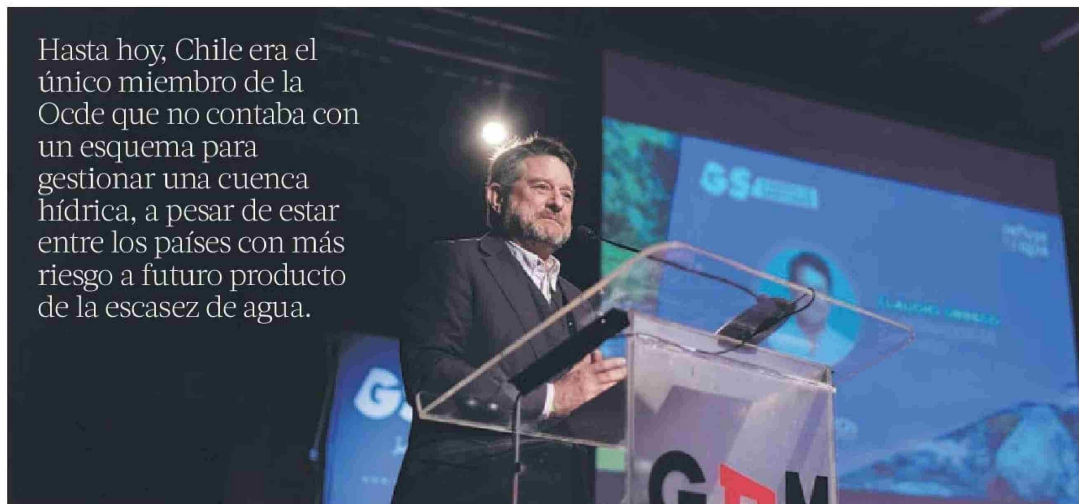
El gobernador de la Región Metropolitana, Claudio Orrego.

Hasta hoy, Chile era el único miembro de la Oede que no contaba con un esquema para gestionar una cuenca hídrica, a pesar de estar entre los países con más riesgo a futuro producto de la escasez de agua.