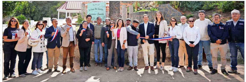
El corte de cinta en la cafetería "La Casa del Jardín" del Jardín Botánico de Viña del Mar.