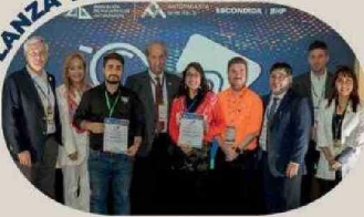
Cobra Ingeniería y WM Technologies SPA obtuvieron el primer y segundo lugar, en la séptima edición de este certamen nacional.