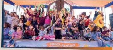
Los Frutantes, juegos, talleres y mucho más convocaron a 10.000 asistentes, en esta fiesta de compromiso con el desarrollo integral de la infancia regional.