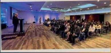
Nuevas tecnologías y herramientas digitales para las PYMES, fue el tema central de este encuentro de innovación.