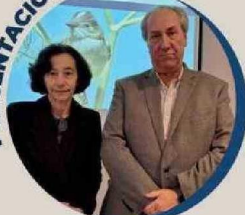
Rossana Costa, Presidenta del Banco Central, destacó el crecimiento económico impulsado por la industria minera y energética, reflejado en el Informe de Política Monetaria.