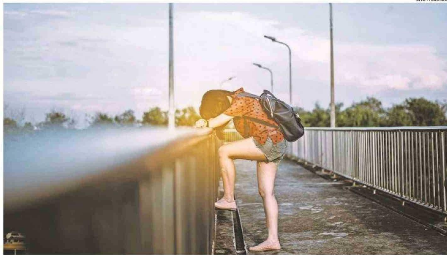
LA ORGANIZACIÓN MUNDIAL DE LA SALUD (OMS) ASEGURA QUE EL SUICIDIO ES UN PROBLEMA DE SALUD PÚBLICA A NIVEL GLOBAL.