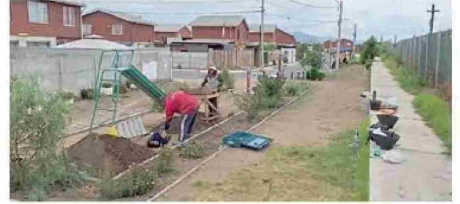
Los pozos de sondeo tienen un metro cuadrado de superficie y una profundidad relativa, la cual puede variar entre los 70 centímetros hasta los tres metros. Siguiendo el trazado del proyecto, los equipos arqueológicos hicieron cerca de mil de estas excavaciones entre Limache y La Calera.

“Primero vino un equipo de arqueólogos e hicieron una inspección superficial, y no detectaron