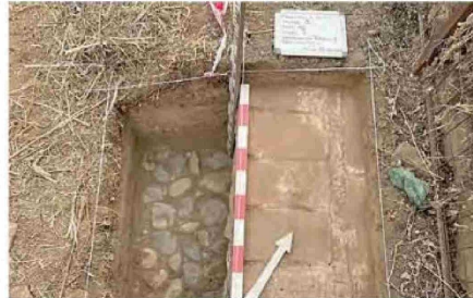
Piso y restos de un muro posteriores a la llegada de los españoles.

Esta etapa no considera levantamiento de cuerpos, por ejemplo,