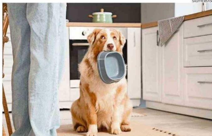
LOS PLATOS DE COMIDA ALOJAN MICROORGANISMOS Y RESIDUOS.