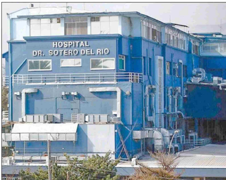
Hospital Sótero del Río en Puente Alto.