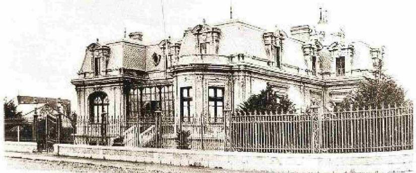
Residencia terminada, fotografía año 1910.