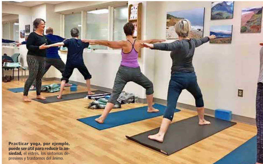
Practicar yoga, por ejemplo, puede ser útil para reducir la ansiedad, el estrés, los síntomas depresivos y trastornos del ánimo.

De hecho, precisa, se sabe que a veces "una terapia complementaria puede ayudar a disminuir la ansie-