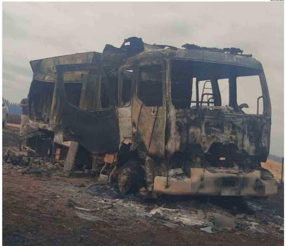
LA TARDE DEL 4 DE FEBRERO, EL MÓVIL DE LA PRIMERA COMPAÑÍA ESTABA EN UN INCENDIO FORESTAL CUANDO TERMINÓ DESTRUIDO.

Este fin de semana se llevará a cabo una reunión del directorio nacional, donde el presidente indicó que “voy a solicitar de forma definitiva la fecha de la orden de compra y la línea de financiamiento para este carro. La idea es poder con-