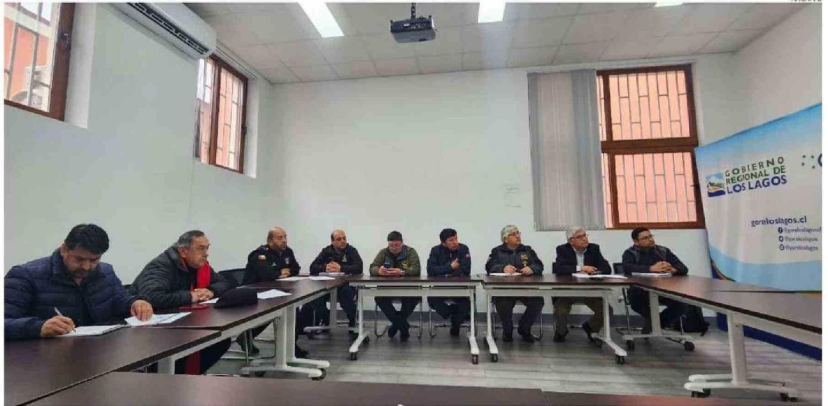
EL PRESIDENTE REGIONAL DE BOMBEROS SE REUNIÓ CON LOS SUPERINTENDENTES DE LA PROVINCIA, DONDE SE INFORMÓ EL TEMA.

El diputado recordó que, junto al superintendente Ro-