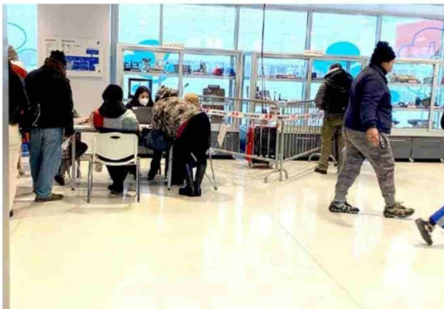
Quienes han acudido al recinto durante los últimos días, han notado el frío que se siente dentro del Hospital.