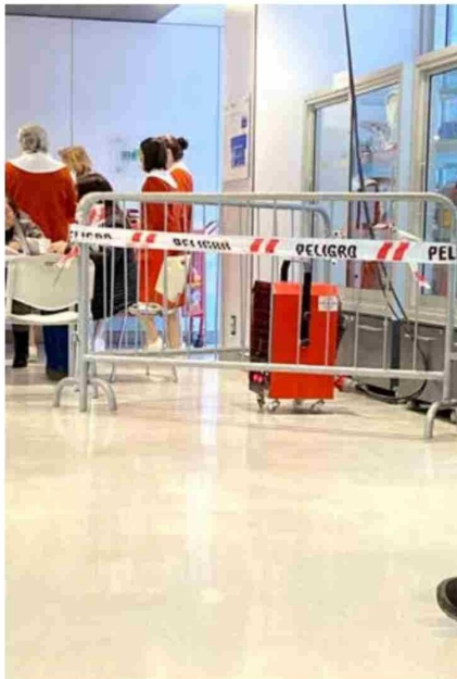
La falla no permite que el sistema de climatización pueda abarcar todos los rincones del nuevo edificio del Hospital de Curicó. En tal contexto, se han tomado medidas provisorias, de cara a lo que debe ser la “solución definitiva”.

Las áreas de pacientes hospitalizados como urgencia, pabellón, parto, entre otras, están cubiertas, mientras que la atención ambulatoria y sobre todo los sectores donde trabaja la mayoría de los funcionarios, y por ende, acude la mayor cantidad público, por ahora tendrán que seguir esperan-