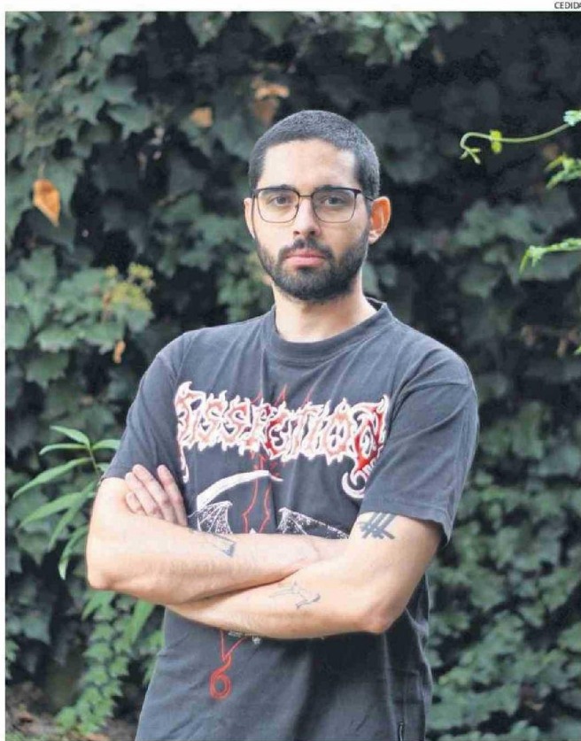
"ME PARECIÓ UN DEBER PUBLICAR ALGO PARA QUE SE HABLE DEL TEMA" SALUD MENTAL, DICE EL AUTOR.

— Afortunadamente soy independiente, no tengo que darle explicaciones a nadie y para mí es un tema súper importante: así como hay gente que tiene la bandera de lucha de los pueblos indígenas u otra causa, mi bandera es la salud mental, y tengo el privilegio de que se me da la escritura, que sé mucho del tema y me pareció más bien un deber publicar algo para que se hable del tema. (Aunque) a veces hablan mucho, pero no ha-