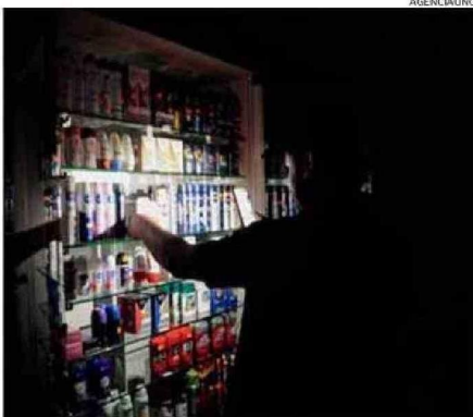
LA EMERGENCIA NO QUEDÓ RESUELTA ANOCHE.

fuerte tormenta con vientos de gran intensidad y lluvias torrenciales dejó sin electricidad a la capital, generó un caos similar y enervó a la población, que en ciertos sectores estuvo casi un mes sin suministro.