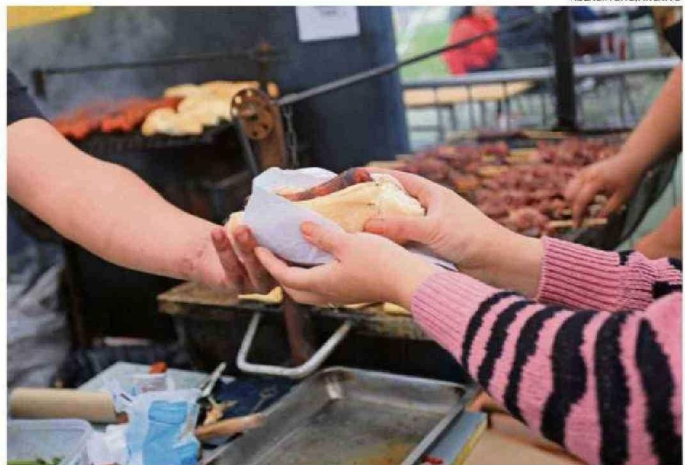
MINSAL CURSÓ MÁS DE 150 SUMARIOS SANITARIOS Y ESPERA REALIZAR 1200 FISCALIZACIONES EN FIESTAS PATRIAS.

Respecto de esta primera celebración de Fiestas Patrias bajo la nueva Ley de Etiquetado de Alcoholes, que se implementó en julio de este año, Albagli dijo que lo importante es “reforzar nuestro mensaje en todos los espacios, ya sea en la mesa, de decir, está la botella sobre la mesa, que esté presente el mensaje de advertencia en la publicidad,