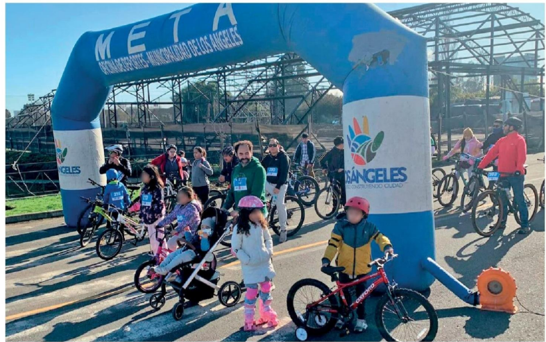
EN SU PRIMERA VERSIÓN la rodada de salud familiar convocó a decenas de participantes.

Según explicaron los profesionales, esta actividad consiste en realizar una ruta recreativa en cualquier vehículo con ruedas, sin motor, es decir, a tracción humana, como bicicletas, scooter, skate, sillas de ruedas, para que las personas que utilizan sillas de ruedas también puedan participar”, indicaron los profesionales.