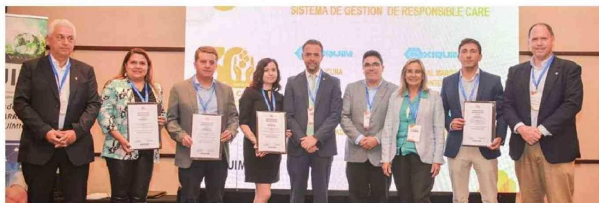
El equipo de Oxiquim que celebró la reverificación de las plantas Quilicura y Escudrón, y terminales marítimos Quintero y Escudrón.