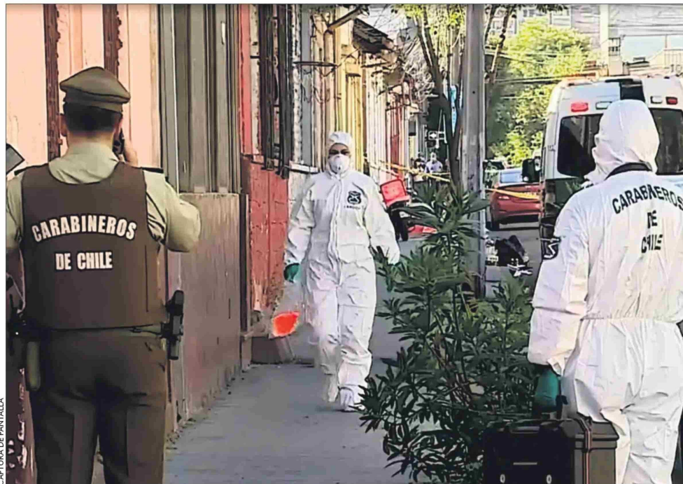
Este lunes ocurrió el primer asesinato del año en la zona roja de Independencia.