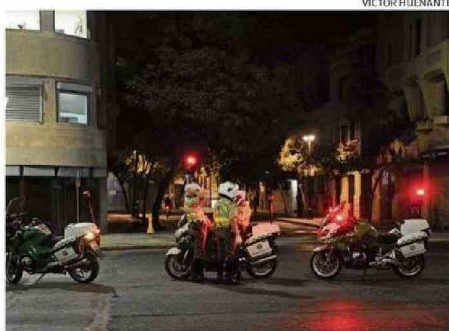
AYER SE LEVANTÓ EL TOQUE DE QUEDA PARA LAS REGIONES AFECTADAS.

A su vez, informó que habrán tres tipos de compensaciones. La primera tiene que ver con el caso de fallas de transmisión. "Corresponde una compensación por todo el tiempo de duración del suministro, que es del orden de 15 meses del precio de la energía no suministrada", dijo Pardow, quien aseguró que en este caso los descuentos se realizarían de manera automática en las cuentas de la luz, los