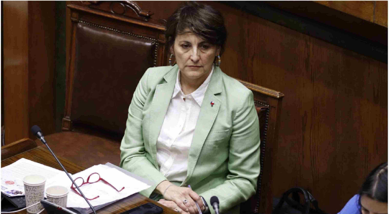
► El Ministerio de Salud, liderado por la ministra Ximena Aguilera, busca contratar una consultoría para crear modelo de listas de espera utilizando inteligencia artificial.