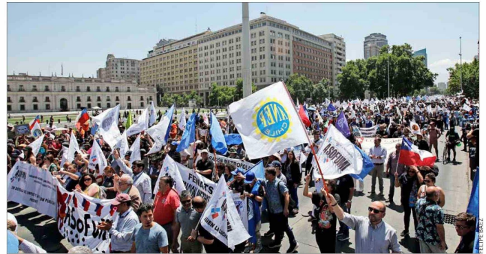
El mayor crecimiento de las huelgas extralegales se explica por la aceleración de la conflictividad en el sector público.

Asimismo, la Región Metropolitana ha perdido su peso relativo histórico en el país desde 2017, mientras otras regiones como las de la zona sur muestran