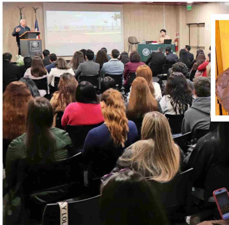
La ceremonia se realizó en el auditorio de Santo Tomás Antofagasta.