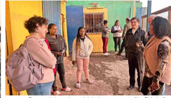
Durante la jornada se visitó el campamento "La Chimba" donde viven muchas personas de Buenaventura.