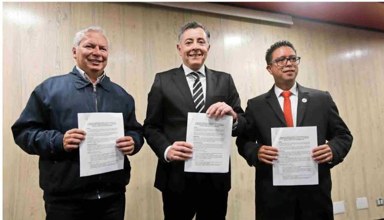
Autoridades de la Universidad Santo Tomás y Universidad del Valle (Colombia) firmaron el inédito convenio.