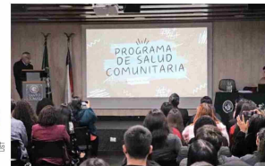
El Programa de Salud Comunitaria se imparte en todas las facultades de Salud de la UST, de Arica a Puerto Montt.