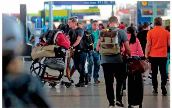
EVOLUCIÓN DEL TRÁFICO AÉREO

El informe adelantado a Pulso también menciona las cinco principales rutas del tráfico aéreo nacional. Entre estas destaca en primer lugar Santiago-Calama, que cerró el año con 2.076.726 pasajeros y una participación de 12,7%. El segundo lugar lo obtu-