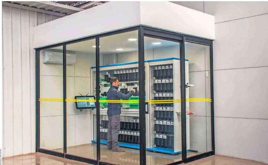
MonnWalk de PPG es el primer laboratorio de pintura que está operativo en Chile y el segundo en Sudamérica

En la actualidad, la empresa automotriz con 81 años de trayectoria tiene operativo su