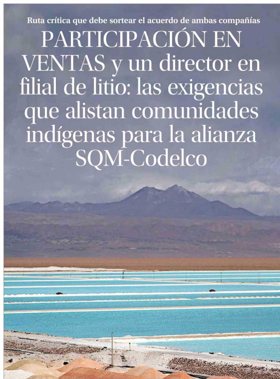
Ruta crítica que debe sortear el acuerdo de ambas compañías

A fines de mayo se inició el frustrado, y se suspendió la primera reunión de la etapa de planificación del proceso. "No se ha retomado el diálogo, hoy no hay un proceso formal. En el intento anterior no se habían generado los lineamientos de acuerdo a la