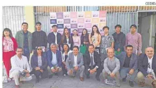
LAS AUTORIDADES FELICITARON LA DEDICACIÓN DE LOS ESTUDIANTES.

De todas maneras, desde el Demre se entregará un informe de resultados a cada establecimiento educacional, el cual presenta una síntesis de los antecedentes de selección y resultados agregados del grupo de estudiantes de cada unidad educativa que participó en el Proceso de Admisión a la Educación Superior 2024, el cual estará disponible a través del Portal Colegios del sitio web.