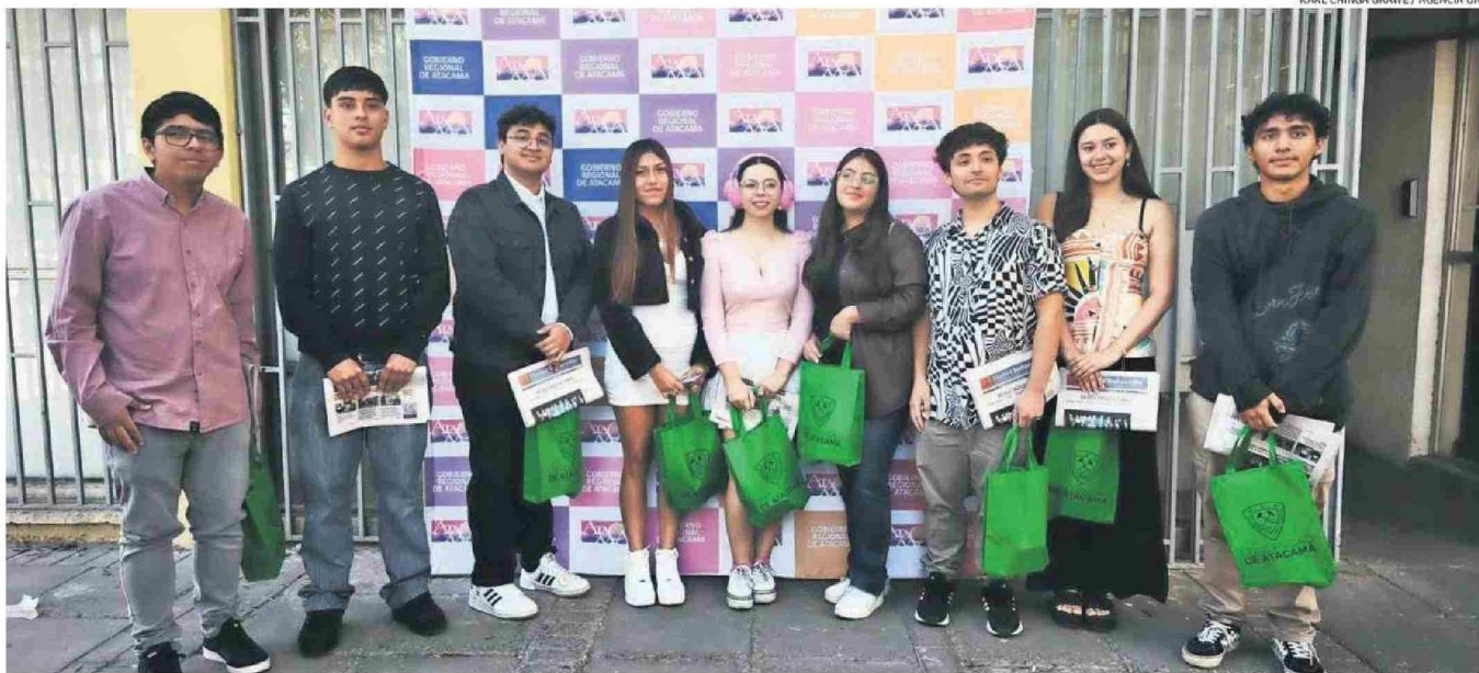
NUEVE FUERON LOS INVITADOS AL DESAYUNO CON LAS AUTORIDADES REGIONALES, AUNQUE SEGÚN DATOS DEL MINISTERIO DE EDUCACIÓN LAS DISTINCIONES POR TRAYECTORIA FUERON DADAS A 17 ESTUDIANTES EN ATACAMA.