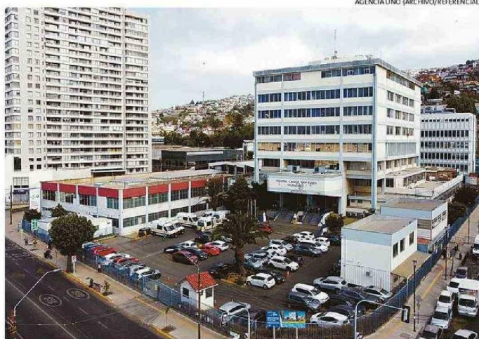
UNIDAD ESTARÍA FUNCIONANDO “AL MÍNIMO” GRACIAS A LAS HORAS DE DOCENTES UNIVERSITARIOS.

ha estado trabajando incesantemente en reducir las listas de espera en consulta y cirugías, sin embargo, con la cantidad de pacientes en espera —más de 4.600— y solo con 11 especialistas, la mayoría de ellos con contratos por 11 horas semanales, con equipamiento obsoleto o en malas condiciones, y con los incumplimientos de las garantías