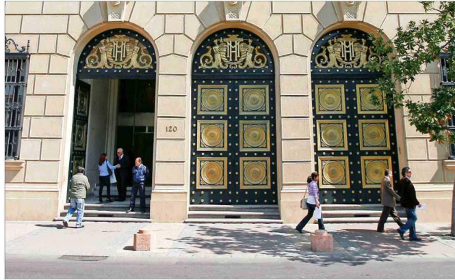
El oficio circular del Ministerio de Hacienda fue dictado a finales de mayo.

El oficio de Teatinos 120, sede del Ministerio de Hacienda, explica que el cálculo para determinar el tope de 1% real en el costo de los nuevos contratos deberá efectuarse considerando la planilla correspondiente al mes anterior del vencimiento del contrato colectivo vigente, "y no se po-