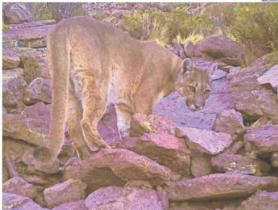
AGRICULTORES DEL ALTO LOA ESTÁN EN ALERTA TRAS NUEVO ATAQUE DEL PUMA EN EL POBLADO DE TURI.

Según estimaciones que han hecho tanto ganaderos como comuneros en el Alto Loa, “son cerca de 200 las cabezas de ganado que se han perdido producto del ataque del puma en los últimos años. Mueren ovejas, llamas, corderos; y en este