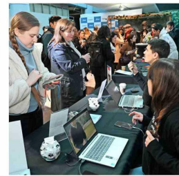
Los asistentes recorrieron los diferentes stands de las fundaciones y universidades que colaboraron en esta 13ª versión de la conferencia organizada por la CChC.