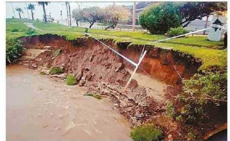
ESTE ES EL SOCAVÓN QUE SE GENERÓ EN EL ESTERO.

En esa línea, añadió, "se debió contar con los permisos de forma previa, no que se haga esto y des-