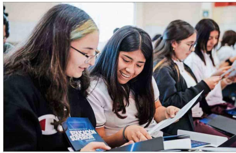
La entrega de material informativo a 588 establecimientos TP y la realización de encuestas están entre las tareas del programa Aspiraciones sobre el Futuro de Fundación Luksic. En la foto, estudiantes del Colegio Parroquial Padre Negro de Caldera.