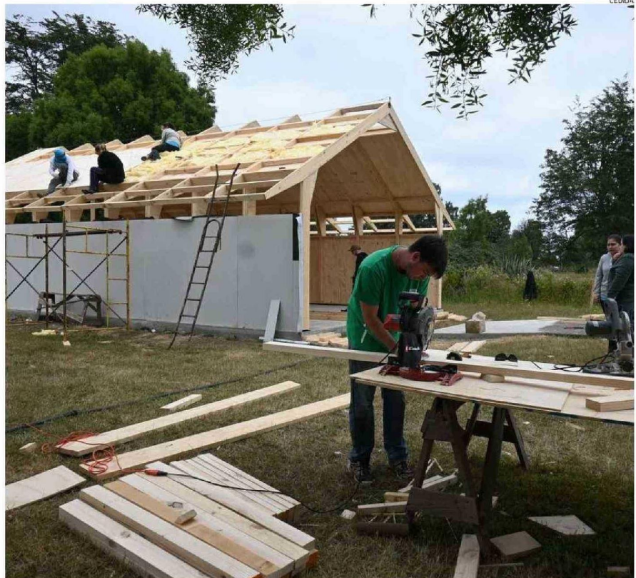
LOS JÓVENES SACRIFICARON PARTE DE SUS VACACIONES PARA VIAJAR AL SUR Y CONSTRUIR LA PARROQUIA EN RUPANCO.

La delegación viajó desde Santiago y se instaló en la escuela del sector, donde hicie-