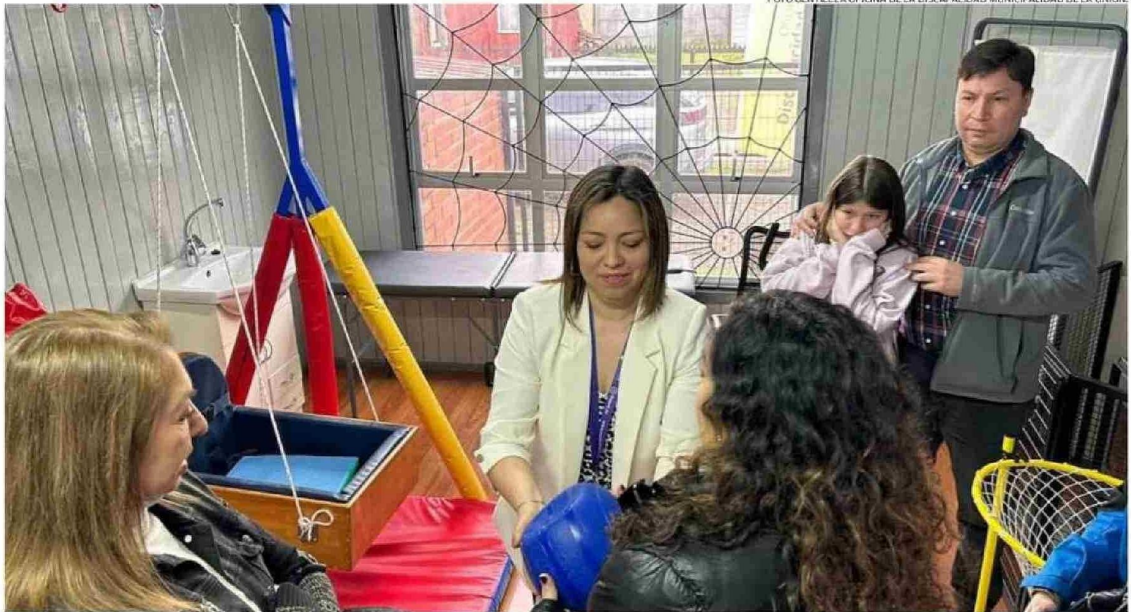
EL CENTRO DE REHABILITACIÓN INFANTIL DE LA UNIÓN ENTREGA TRATAMIENTO A NIÑOS DESDE LOS MESES DE VIDA EN ADELANTE, HASTA LOS 18 AÑOS DE EDAD.

Mientras que sobre el equipo de profesionales, el encargado de la Oficina de la Discapaci-