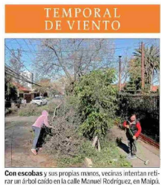
Con escobas y sus propias manos, vecinas intentan retirar un árbol caído en la calle Manuel Rodríguez, en Maipo.

TEMPORAL DE VIENTO Persiste la emergencia: El regreso de la electricidad en la RM tomará al menos hasta mañana y se suman cortes de agua