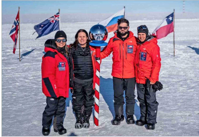
El Presidente Gabriel Boric, junto con la ministra de Defensa, Maya Fernández Allende, y del Medio Ambiente, Maisa Rojas, entre otros integrantes de la comitiva, que fue parte de la reciente visita al Polo Sur.

Ante la controversia, Boric afirmó que “si eso no está solucionado, no se puede hacer la compra, porque en Chile las ins-