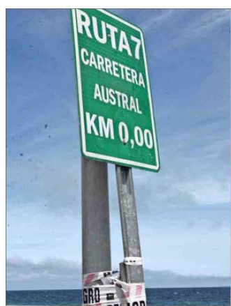
Este cartel es el que hasta ahora marca el inicio de la carretera.

retera Austral y celebre su valor histórico, geográfico y social, capture su esencia, convirtiéndose en un punto de referencia para los turistas y un lugar de encuentro para la comunidad”, dice la publicación en el sitio web del MOP.