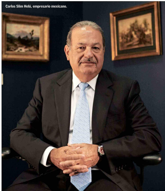
Carlos Slim Helú, empresario mexicano.

Comprar Wom sería su tercer gran hito en Chile. El primero fue la entrada en 2004,