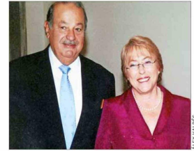
Con la expresidenta Michelle Bachelet.

a través de la adquisición de AT&T Latam por Telmex (Teléfonos de México). Ese mismo año compró ChileSat al grupo Southern Cross, dentro del "plan de internacionalización de la empresa" en ese momento.