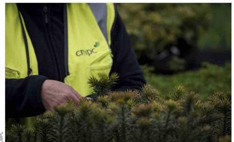
La Estrategia de Naturaleza, Conservación y Biodiversidad, entre otros objetivos, busca poner en valor más de 400 mil hectáreas de bosques que poseen en Chile, Brasil y Argentina.

ambientales y conocimiento general, mediante un circuito debidamente protegido y sustentable que permitirá recorrer y conocer parte de la flora y fauna nativa de mayor relevancia para el estado.