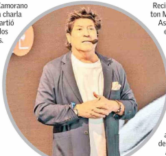
Iván Zamorano durante la charla que compartió con todos los invitados.

Recientemente, en el Hotel Sheraton Miramar de Viña del Mar, Astara Chile realizó una nueva edición de su Dealer Meeting, en la que hizo una invitación a "impulsar el futuro juntos". En la instancia se reunieron los ejecutivos de la red de concesionarios que comercializan las marcas representadas por Astara, los ejecutivos que gestionan la relación con dichos concesionarios, los gerentes de las marcas, así como los representantes de los socios estratégicos de Astara, quienes analizaron las tendencias de la industria automotriz, reflexionaron sobre los logros de 2024 y los