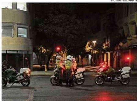
AYER SE LEVANTÓ EL TOQUE DE QUEDA PARA LAS REGIONES AFECTADAS.

A su vez, informó que habrán tres tipos de compensaciones. La primera tiene que ver con el caso de fallas de transmisión. "Corresponde una compensación por todo el tiempo de duración del suministro, que es del orden de 15 meses del precio de la energía no suministrada", dijo Pardow, quien aseguró que en este caso los descuentos se realizarían de manera automática en las cuentas de la luz, los