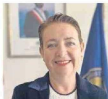
Karen Behrens Delegada presidencial

“En materia de seguridad, el 2025 verá la concreción y el avance de grandes obras en infraestructura policial en Antofagasta, Calama y Tocopilla, y continuaremos con la renovación del parque vehicular de Carabineros”, sentencia la delegada. En esa línea, apunta a que “los resultados del plan ‘Calles Sin Violencia’ han demostrado ser una herramienta positiva para la disminución de homicidios, siendo 15,1% menos respecto al 2023 y 30,8% al año 2022”.