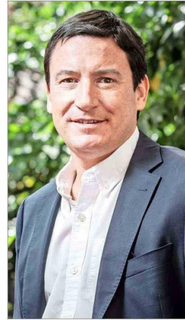
Arturo Squella, presidente del P. Republicano.